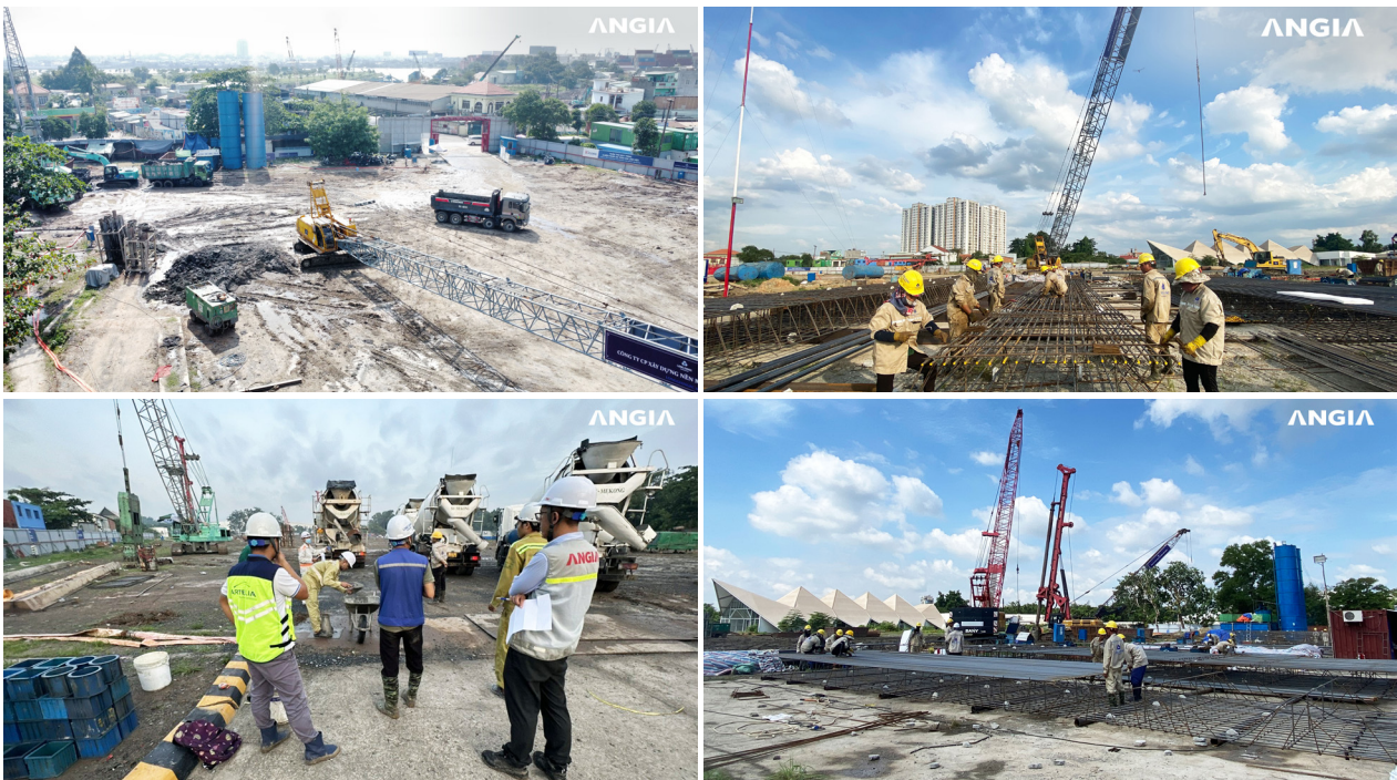
Công trình dự án The Gió

Trong tháng 6/2024, An Gia đã chính thức tổ chức lễ khởi công dự án The Gió Riverside, khu phức hợp ven sông Đông Sài Gòn với quy mô khoảng 3.000 căn hộ. Tiến độ dự án hiện đang triển khai các hạng mục cọc khoan ngổ và tường vây, dự kiến sẽ được mở bán khi có nghiệm thu hoàn thành xây dựng phần móng trong Q4/2024.